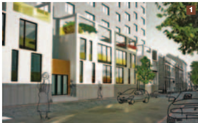
2. cena – Humanizace obytného souboru v Přerově

Určitě osloví širší skupinu studentů. Uzávěrka soutěžních prací bude 20.1. 2011.