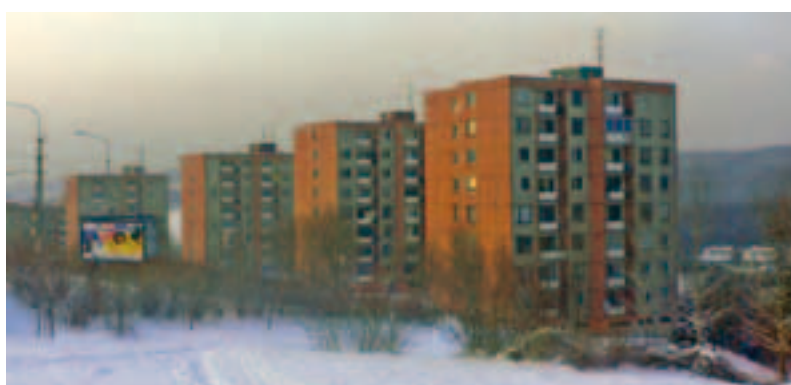
Současnost souboru budov